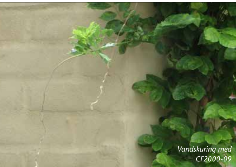
Vandskuring med CF2000-09

Produktet er vejrbestandigt, modstandsdygtigt og udelukkende fremstillet af naturlige råstoffer. Produktet har en god vedhæftnings- og dækkeevne, og er meget let og smidig at arbejde.