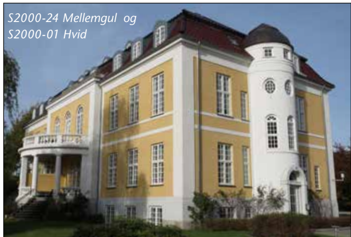
S2000-24 Mellemgul og S2000-01 Hvid