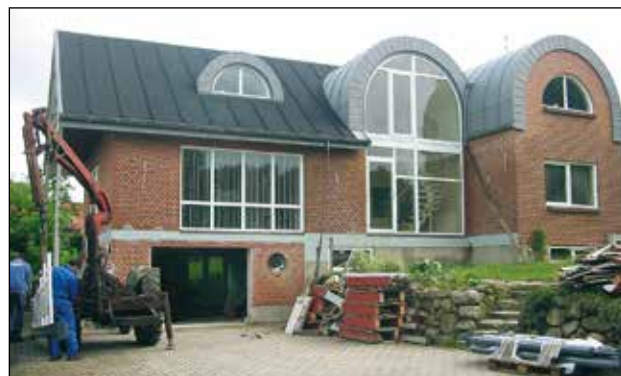
Før- og efterbilleder af hus vandskuret med Skalcem CF2000. Vandskuring fornyer udseendet på et hus, og giver det et elegant og tidløst look.

Produktet bør ikke anvendes på visse typer gule maskinsten, da der her kan være risiko for frostsprængninger. Kontakt Skalflex for yderligere information.