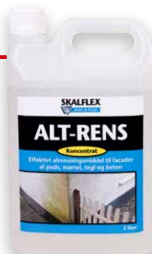
2 liter koncentrat DB-nr: 5042132