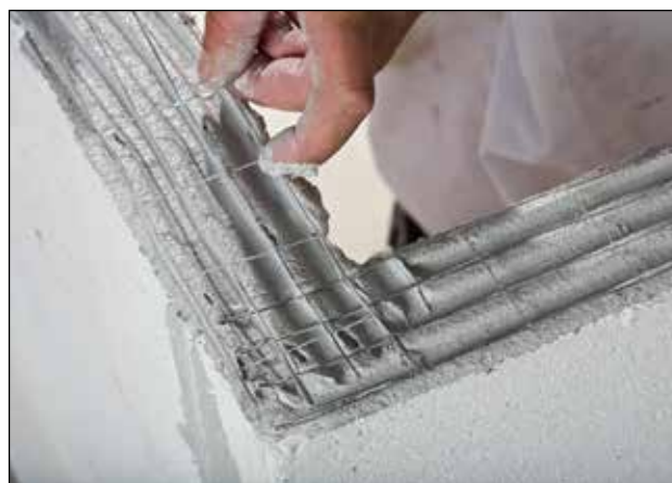
Selv ved smalle bloksten skjules armeringen fuldstændig i fugen.