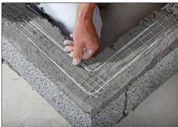
Hjørne forstærket med Bloktec® tyndfugearming og hjørneprofiler.