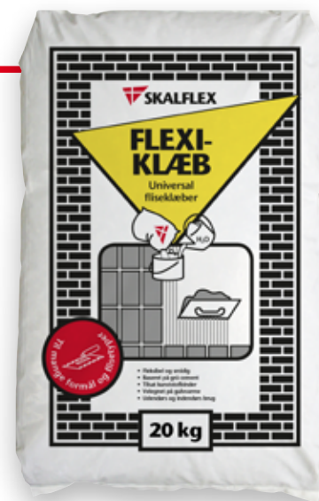
20 kg, DB-nr: 1458276