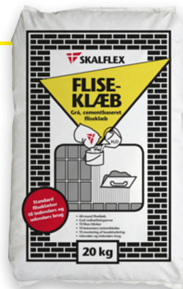
20 kg, DB-nr: 1935011