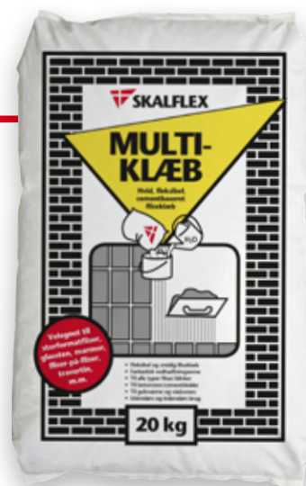
20 kg, DB-nr: 1257737