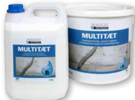
Sæt á 5/15 kg, pakket i kasse: DB-nr. 1547773