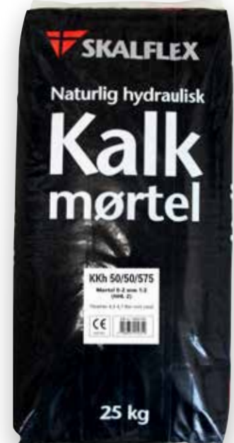
25 kg DB-nr. 1900766