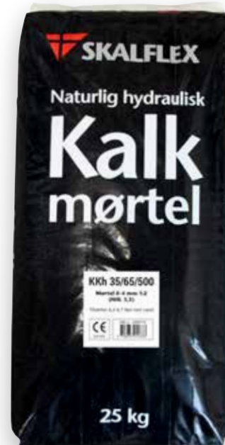
25 kg DB-nr. 1900773

Se sikkerhedsdatabladet, som forefindes på www.skalflex.dk for yderligere oplysninger.