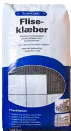
Scan Fliseklæber 20 kg DB-nr: 1580752