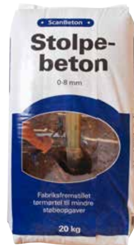
Scan Stolpebeton 20 kg DB-nr: 1973687