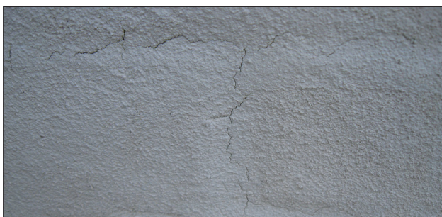
Vandskuringspudsen slår revner pga. for dybe fuger.

Det kan være svært for håndværkeren at forhindre disse revner, når der puds, fordi de er så små at håndværkeren ikke kan se, når de opstår. Som forebyggelse anbefales det altid at forvande underlag før påføring af mørtel, altid arbejde i skygge, undlade at blande for meget vand i mørtlen, bruge så lidt vand som muligt til filtsning, eftervande facaderne, når det er meget varmt og tørt, aldrig filts på våde underlag, som ikke er sugende. Helt undgå at der kommer revner kan være svært, fordi vejrliget kan skifte under udførelse – der startes i overskyet vejr, hvorefter solen kommer igennem og tørrer mørtlen – det er som regel sydvendte facader, disse revner ses på.