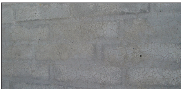
Vandskuret facade med kosmetiske netrevner.

Svindrevner i pudsede og vandskurede facader er et kendt problem, som kan opstå i forbindelse med hærdning. Ved forkert optørring kan der opstå revner, fordi mørtlen krymper. Disse revner er hårfine og kan kun ses under mikroskop, men når der kommer til at sidde snavs i revnen ofte 1-3 år efter, ses den som en blyantstreg på facaden. I de fleste tilfælde er disse kun af kosmetisk art, og vil forsvinde ved første behandling af bygningen.