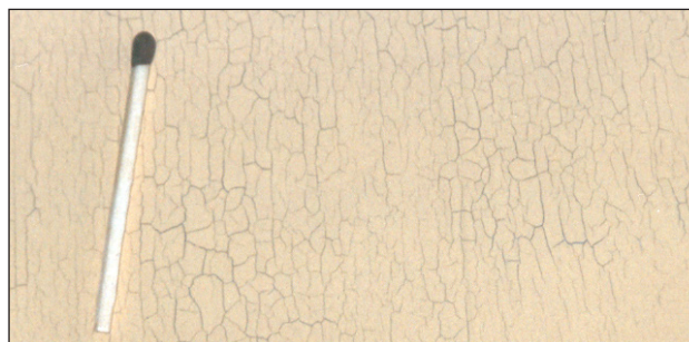
Krakelering af maling, der er lagt på i for tykt lag. Bemærk, hvor tæt netmønstret sidder.

over en hel facade, fordi det er meget svært at påføre en maling i så tykt lag på lodrette flader. Det kan forekomme i forbindelse med at det er stænkpuds der males, her vil revnerne ligge i bunden af strukturen. Det kan også forekomme på vandrette murflader, hvor det er forholdsvis let at påføre et for tykt lag.