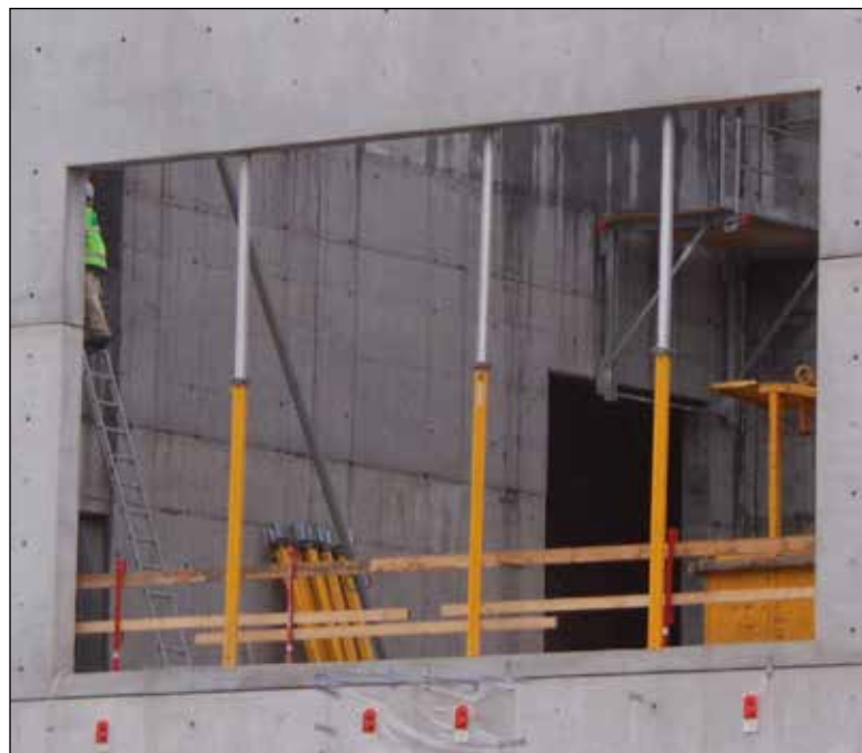
Vent med montering af vinduer til al beton og mørtelarbejde er færdigt.

Det er sædvanligvis ikke ved kraftige regnskyl, at risikoen